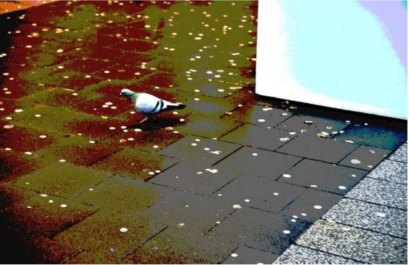
“Shadow-Birds I.” - (Schadowstr.)