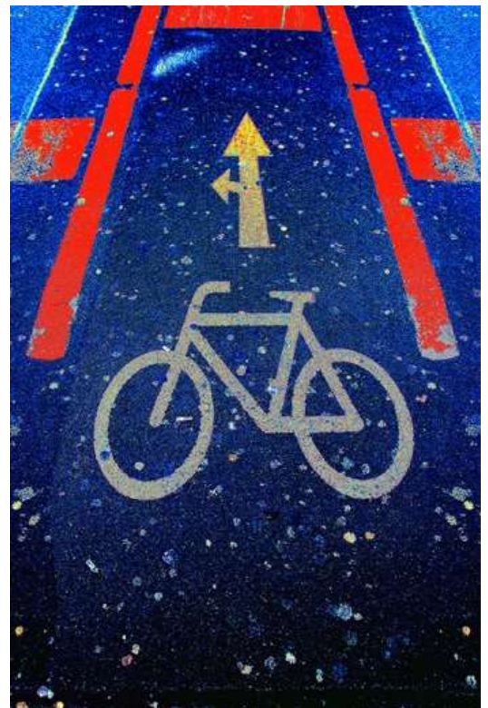
„Wo bitte geht’s lang?“ (Bismarck-Ecke –Karlstr.)

Das Thema soll mit einer noch zu gestaltenden Aufklärungskampagne und weiteren Aktionen/Führungen u.a. für Kinder erweitert werden.