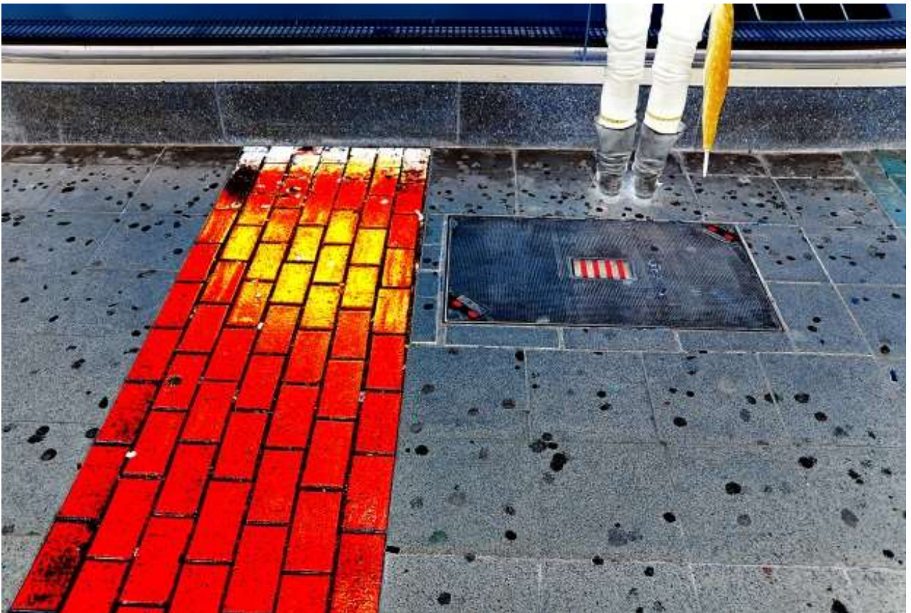
“Nice window-shopping” - (Schadowstr.)