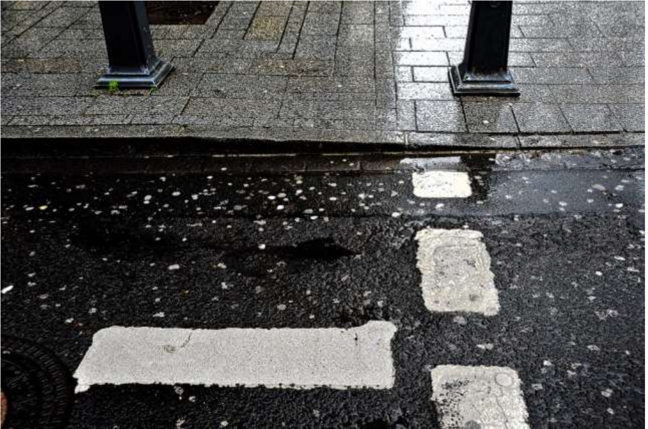
„King`s Cross“ (Königsalle)