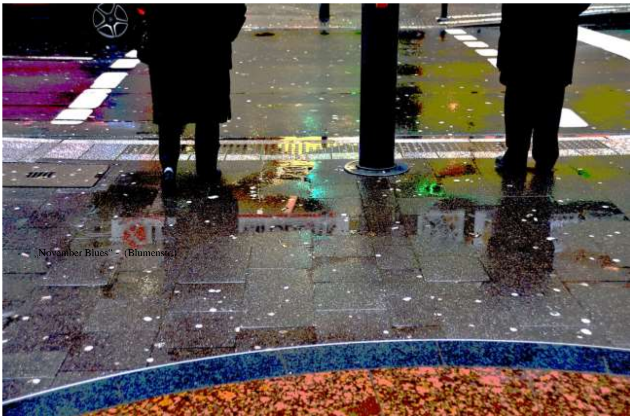
„November Blues“ - (Blumenstr.)