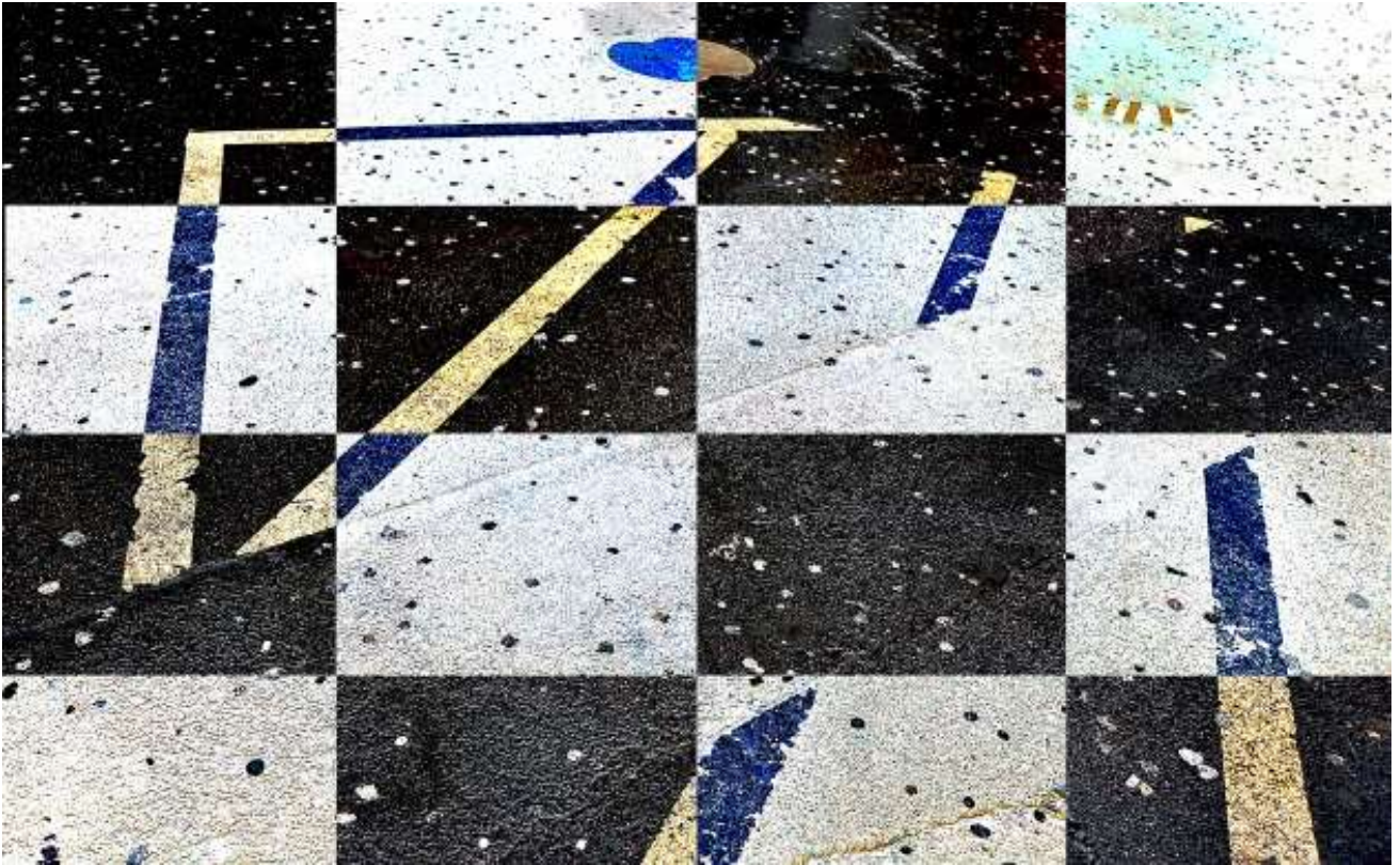
“Wrong chess.” - (Mühlenstr.)