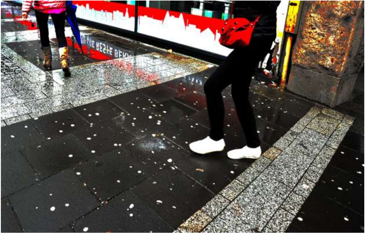
“Walking in the rain” - (Schadowstr.)