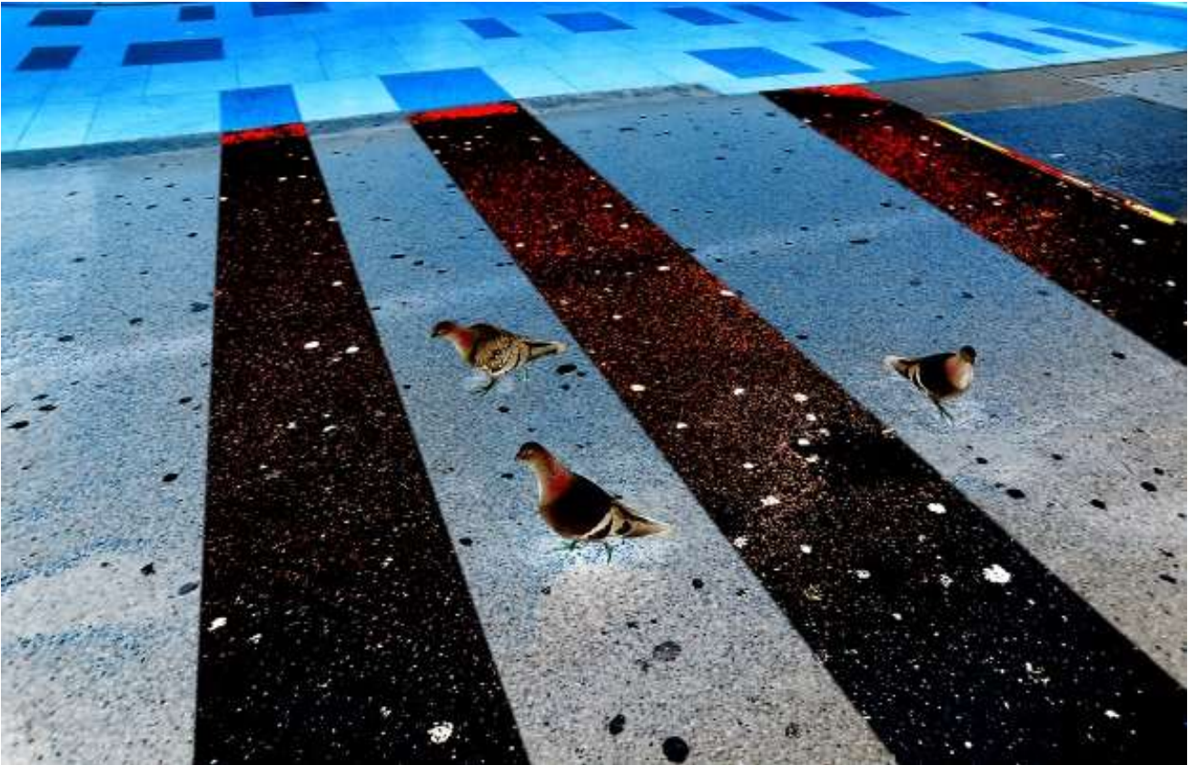
“Shadow-Birds II.” - (Schadowstr.)